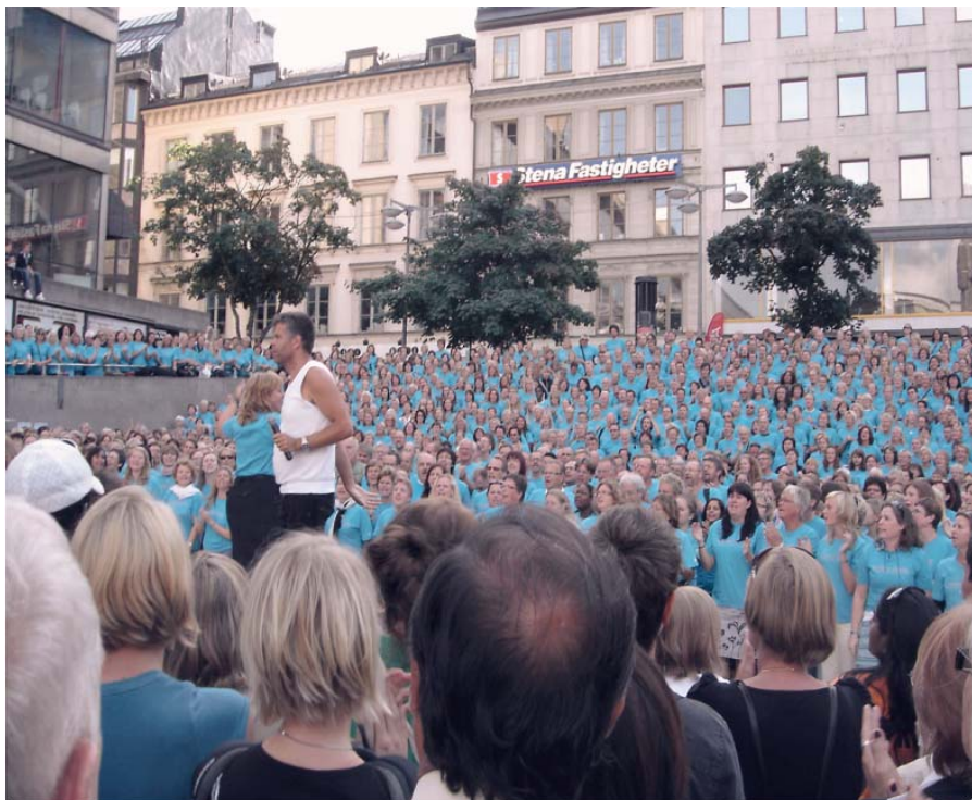
Konsert på Sergels torg