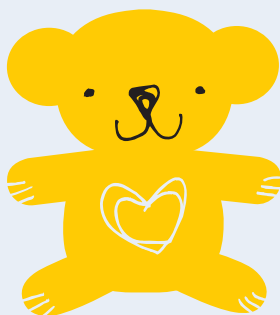
Illustration: Susanne Engman/IKON